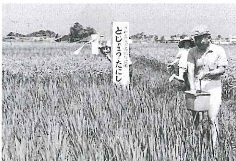
タニシの養殖をする教育委員会の職員たち(昭和43年10月)

これを見ると、ツル保護会の業務の基本的方向は現在まで変わらないものの、いくつかは、当時のツル保護を取り巻く状況が推察されて興味深い。例えば、「ドジョウの養殖」は、この後もしばらく研究が続けられたが、現在ではツルの餌は小麦が主体となっている。また、「飼料倉庫」は、それまで、個人の農業倉庫の一部を借用していたが、新たに五坪の木造タン葺きの小屋を建てた。現在では、荒崎のツル保護センター内に鉄筋コンクリート製の倉庫が整備されている。羽教や生態の調査については、それまで一部の有志や学校関係者で続けられていたが、ツル保護会を中心にして関係者の連携が図られるようになり、記録が積み重ねられていく。昭和三十八年度は、生態・羽数調査謝金の支払い先として、庄中学校・野田中学校・高尾野小学校の三校の名前を見ることのできる。（出水郷土誌下巻 特別編ツル）・・・次号へ続く