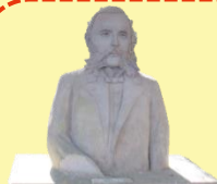
観光牛車茶屋 大久保利通シラス像