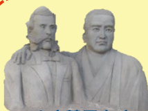
出水麓歴史館 大久保利通 西郷隆盛シラス像