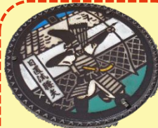
日置流騰矢 マンホール