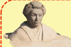
中井勝郎 美術古文書館 麓姫シラス像