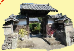
中井勝郎 美術古文書館