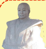
出水麓歴史館 島津斉彬シラス像