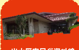
出水歴史民俗資料館