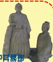
中井勝郎 美術古文書館 坂本龍馬シラス像