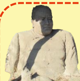
中井勝郎 美術古文書館 西郷隆盛シラス像