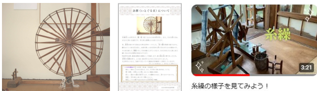
糸繰の様子をみてください！

お貸しできる資料は、一部(例：糸車)に限られますが、資料を間近にご覧いただける貴重な機会になると考えられます。資料を使用している様子を撮影した動画も YouTube チャンネルにて投稿しています。あわせてご活用ください。また、昔のおもちゃの貸出し等もご相談に応じることができます。お問い合わせください。