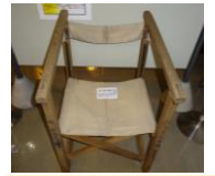
海軍航空隊出水基地の折り畳み椅子