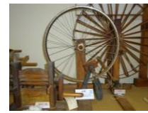
車輪を再利用した糸車