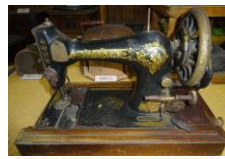
アメリカ製ミシン

近年ご寄贈いただいた資料3点を新たに展示しました。ご来館の際にはぜひご覧ください。